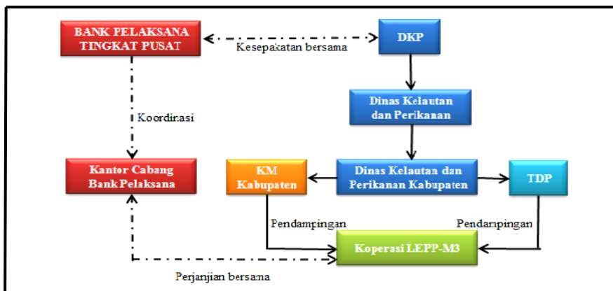
Gambar 1. Bagan Organisasi Pengelolaan Pemberdayaan Ekonomi Masyarakat Pesisir (PEMP)